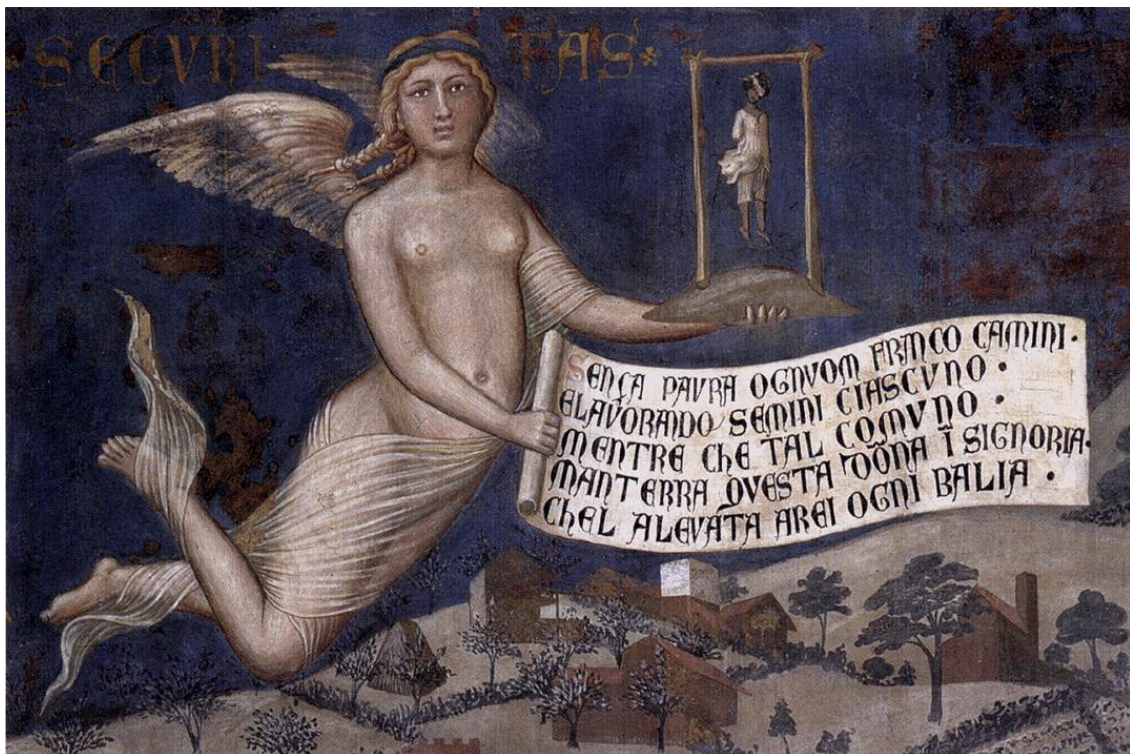
2. kép: Ambrogio Lorenzetti: A Jó kormányzás hatása a vidékre (részlet)