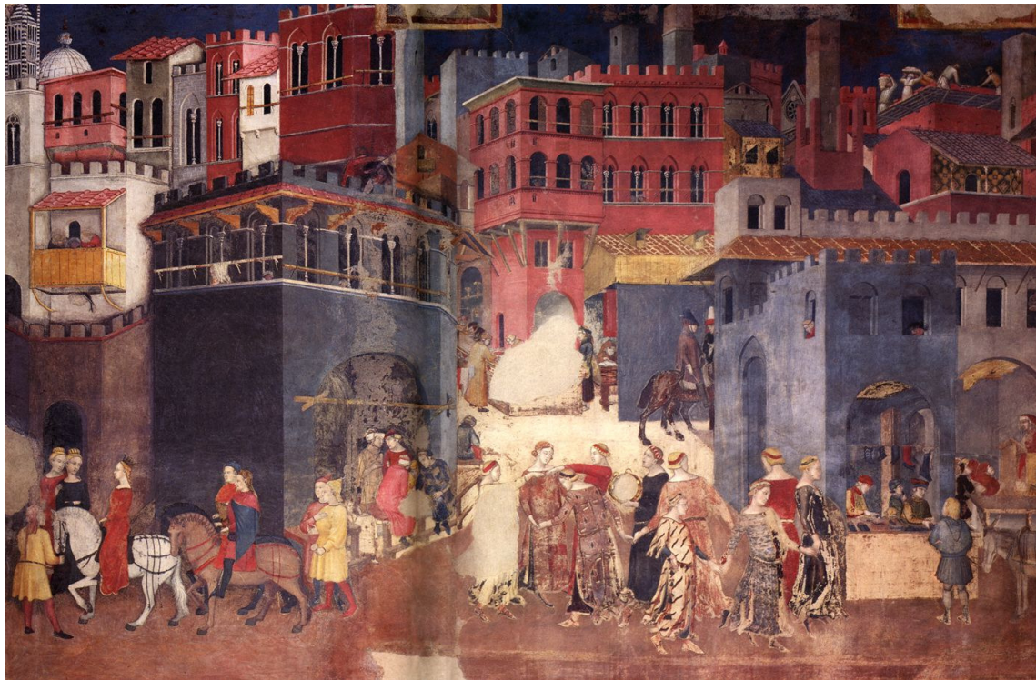
1. kép: Ambrogio Lorenzetti: A Jó és a Rossz kormányzás allegóriája. Siena, Palazzo Pubblico, Sala dei Nove. A Jó kormányzás hatása a városra (részlet)