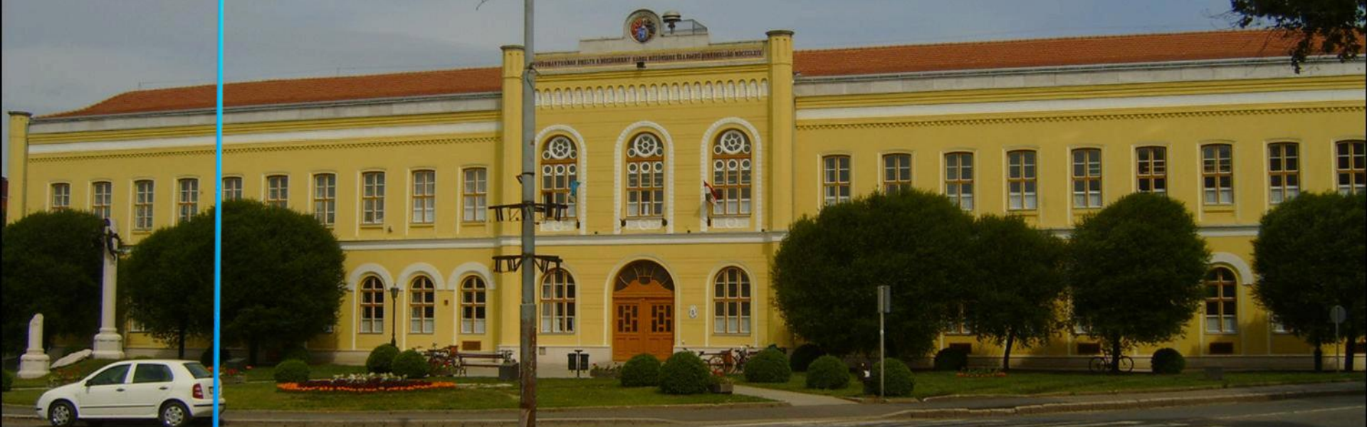
Bocskai István Gimnázium