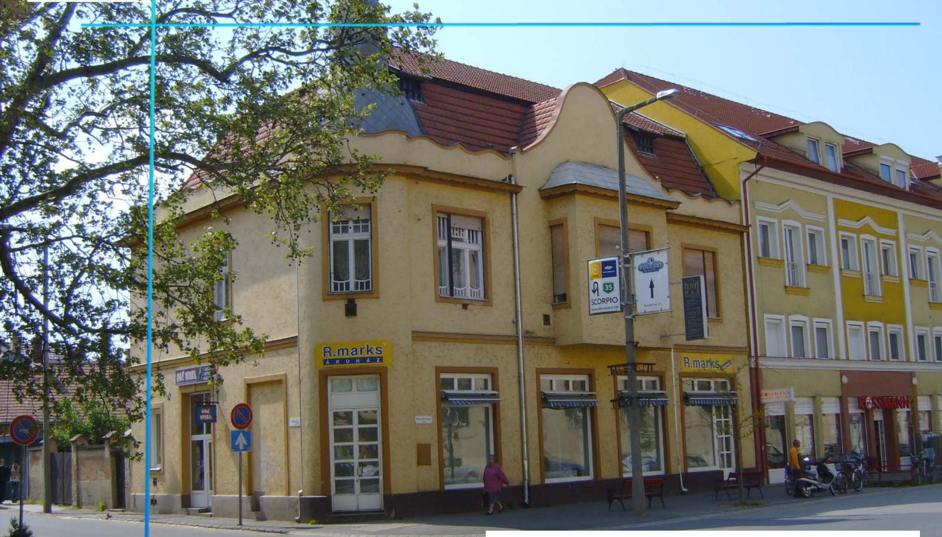
Kossuth u. 7. (Lakóépület üzletekkel)