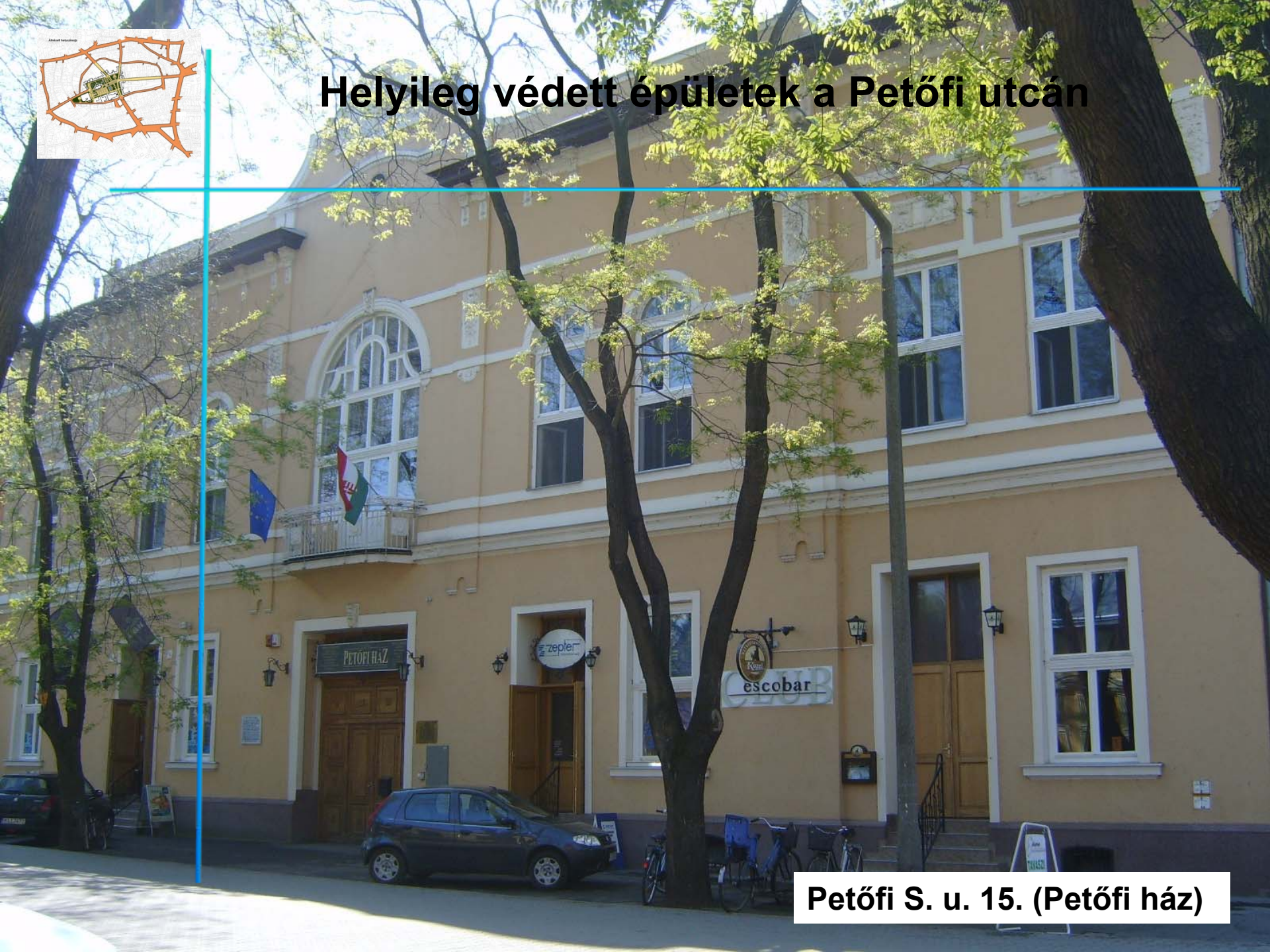
Petőfi S. u. 15. (Petőfi ház)