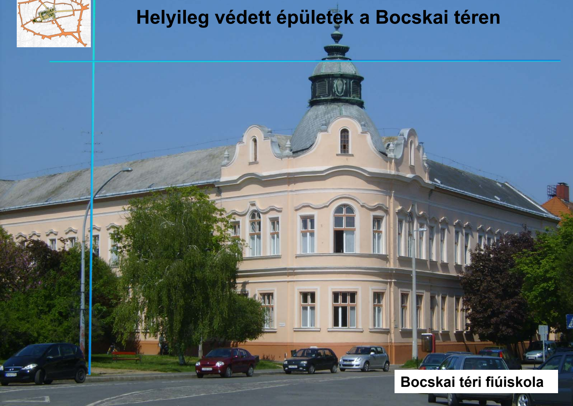
Bocskai téri fiúiskola