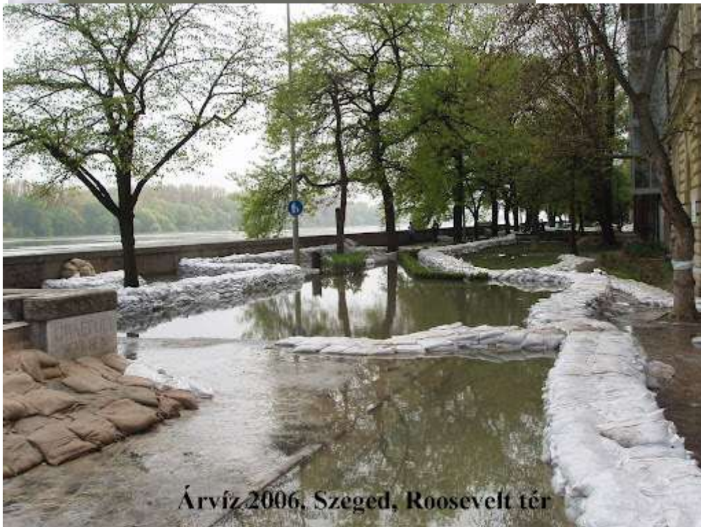
Árvíz 2006. Szeged, Roosevelt tér

http://www.ativizig.hu/vedekezés/Arvizvedelem