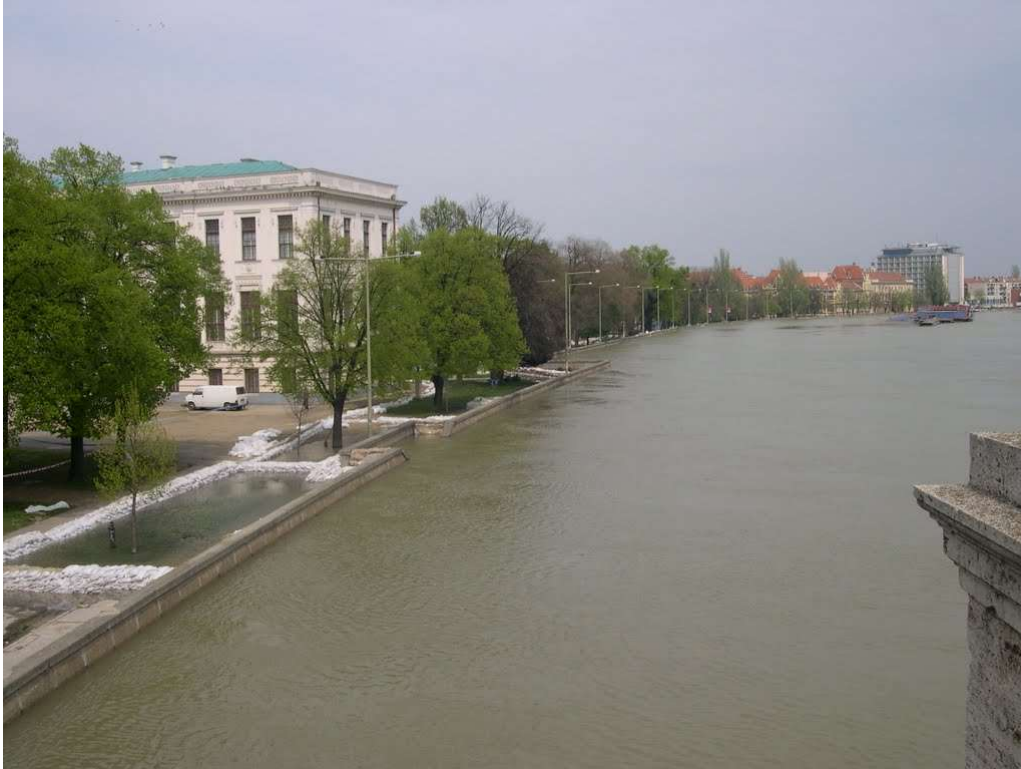
Víz partfalon innen és túl - árvíz 2006.