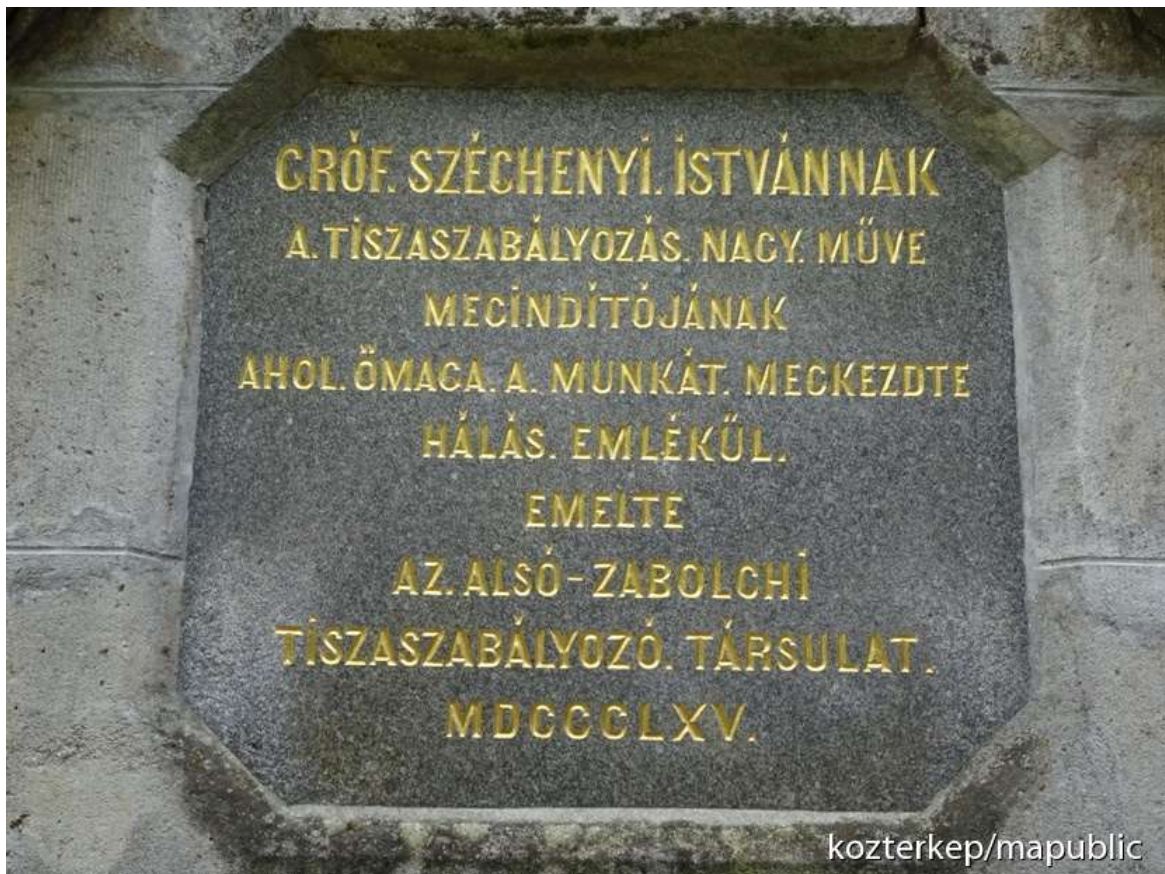
A Széchenyi-obeliszk Tiszadobon és